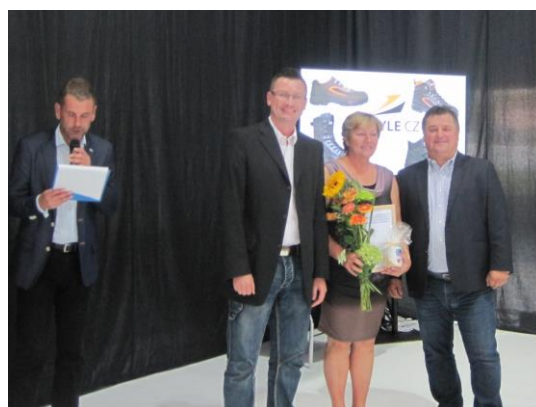
Slavnostní předávání nových certifikátů zástupcům firem Boty Beda, Pegres a Z-Style v Brně při veletrhu KABO II 2017