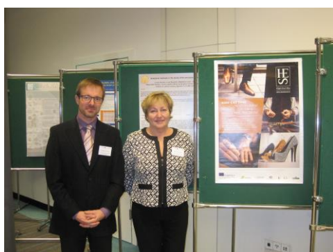
Účast zástupců ČOKA na veletrhu v Lodži

1. Zástupci ČOKA měli přednášky na odborném kongresu Mat-Eko-Shoes v polské Lodži. Tento kongres se konal při veletrhu Rehabilitacja. Zahraničních cest a účastí na kongresech je využíváno k propagaci členských firem ČOKA a veletrhu KABO.