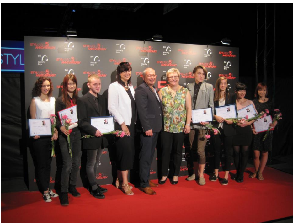
Vítězové a hlavní sponzoři XI. ročníku soutěže o Cenu Nadace Jana Pivečky 2017