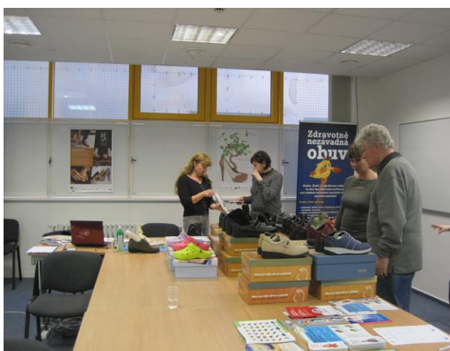
Infomační materiály v poradně

3. Další projekt podpořený z fondu zdraví statutárního města Zlína pro se týkal dětí v MŠ a měl název „Zdravou obuví ke zdravému vývoji dětské nohy“. V roce 2017 proběhlo celkem 8 akcí v MŠ spojených s diagnostikou a měřením nohou a s poradenstvím pro rodiče.