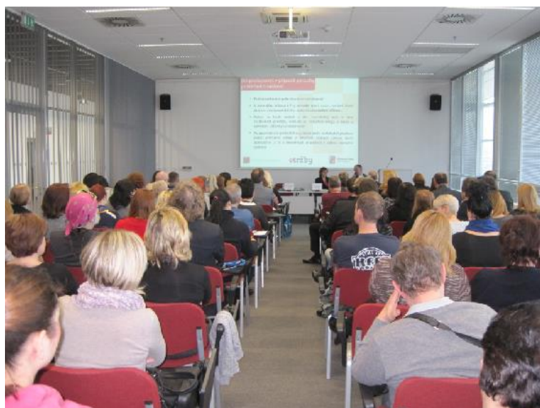
Ze semináře k EET v Brně – přednášející byli pracovníci MF ČR

4. Byl zorganizován seminář k EET při veletrhu KABO I 2017, kde se mohli účastníci zeptat zástupců MF ČR na vše, co je zajímavé a co potřebovali vědět. Podrobné materiály k zavádění EET byly zaslány všem přítomným i členům ČOKA.