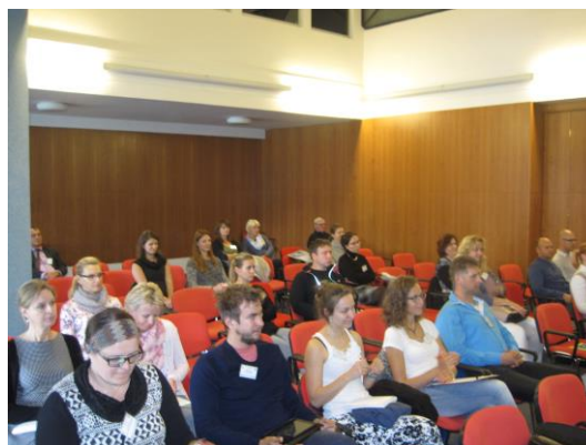
Přednášející a posluchači XV. MPS v Brně

4. Byl zorganizován seminář k EET při veletrhu KABO I 2017, kde se mohli účastníci zeptat zástupců MF ČR na vše, co je zajímavé a co potřebovali vědět. Podrobné materiály k zavádění EET byly zaslány všem přítomným i členům ČOKA.