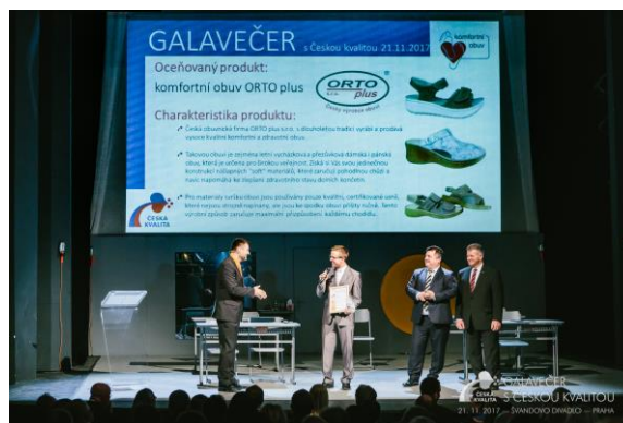
Slavnostní předávání nových certifikátů zástupcům firem DZO a Orto plus v Praze na listopadovém galavečeru s Českou kvalitou 2017