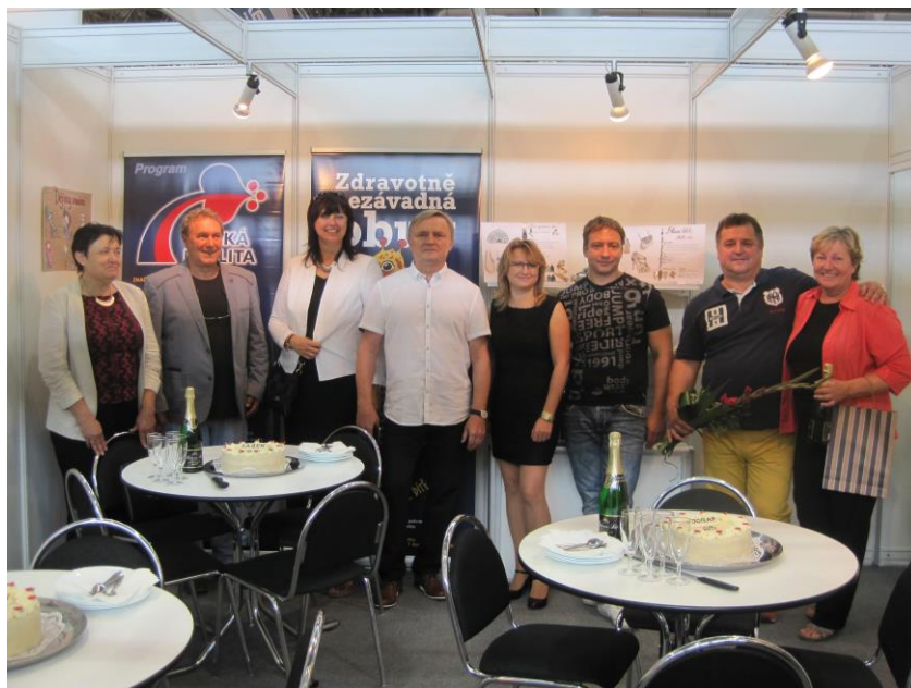
Společná gratulace se zástupci a.s. Veletrhy Brno na stánku ČOKA členským firmám, které v roce 2017 oslavily 20 let a 25 let od svého založení