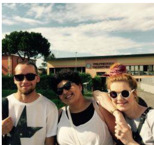
Naši studenti na stáži v Itálii

1. ČOKA se aktivně podílela na řešení mezinárodního projektu High-end Shoes (HeS), který byl realizován v rámci programu ERASMUS+ a zaměřen na výrobu luxusní obuvi a na mladé designéry. Projekt má umožnit lepší zapojení mladých designérů do obuvnické výroby. ČOKA v rámci projektu vyslala 2 učitele odborných předmětů z Univerzity Tomáše Bati (UTB) a SUPŠ na týdenní stáž do Portugalska. Dále byli vysláni 3 studenti na 14-ti denní stáž do italské Padovy na Politecnico Calzaturiero. ČOKA opět organizovala a hradila z projektu pobyt těchto 3 studentů. 2 studentky byly z ateliéru designu obuvi FMK UTB a 1 student z Jihočeské univerzity. Námi vyslaní studenti patřili v rámci kurzu k nejlepším. Zástupci ČOKA se účastnili v roce 2017 rovněž 2 zasedání k projektu HeS – první bylo v Portu a druhé při veletrhu Micam a Mipel v Itálii, kde proběhl i závěrečný mítink a tisková konference. Projekt byl ukončen k datu 30.9.2017.