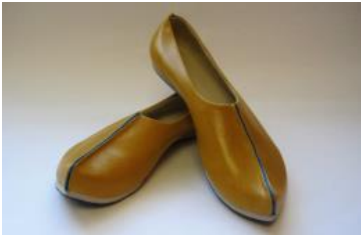
Vítězné práce z XI. ročníku soutěže o Cenu Nadace Jana Pivečky 2017