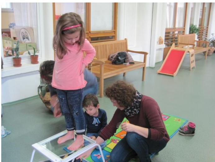
Měření nohou dětí a poradna v MŠ

4. Průběžně byly sledovány výzvy v rámci programovacího období 2014-2020 a pokud byly pro firmy vhodné, ČOKA vždy o nových výzvách a možnostech informovala všechny členy ČOKA. Zejména se jedná o výzvy v OPPIK „Marketink“ a „Úspory energie“, ale také „Technologie“, „Potenciál“ nebo „Inovace“.