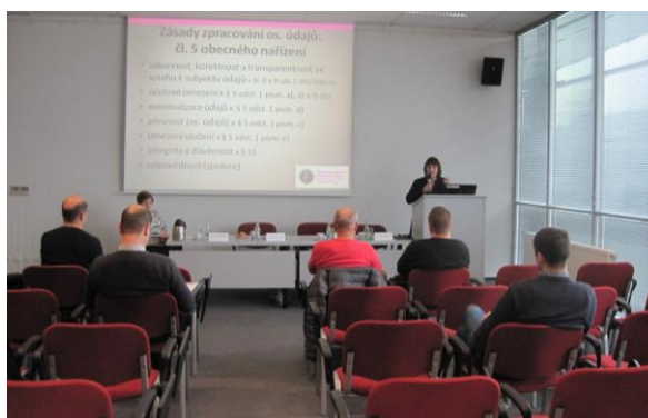
Předávání nových certifikátů na veletrhu KABO a seminář k GDPR