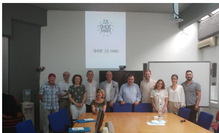
Ze zasedání k projektu Shoeman v Chani