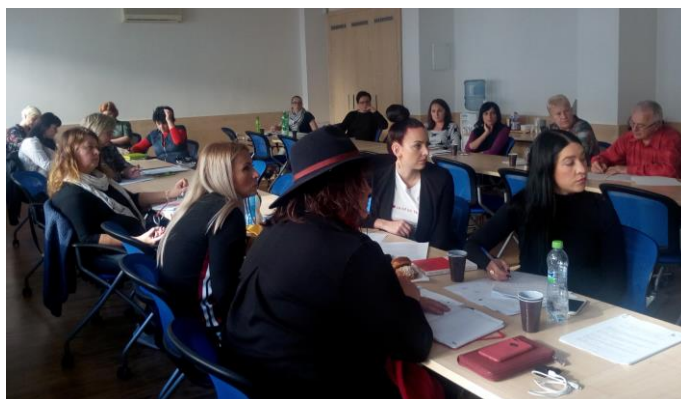
Školení k reklamačnímu řízení v Brně