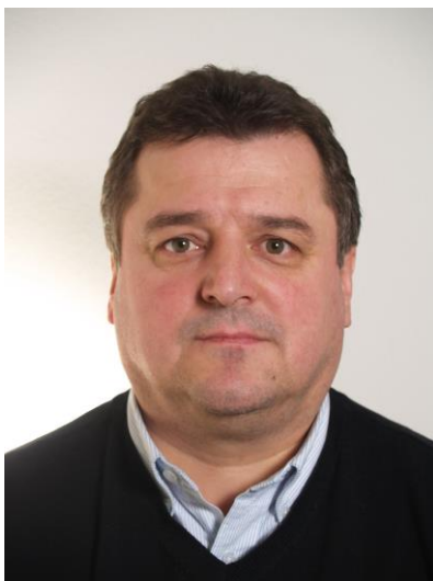
Miroslav Bisek – prezident ČOKA